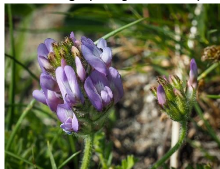
Hans Peder Cappelørn

Gyvel ( Cytisus scoparius ) 3. Mangebladet lupin ( Lupinus polyphyllus ) 4. Dansk astragel ( Astragalus danicus ) 4. :