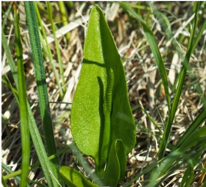
Hans Peder Cappelørn

Slangetunge ( Ophioglossum vulgatum ) 2. :